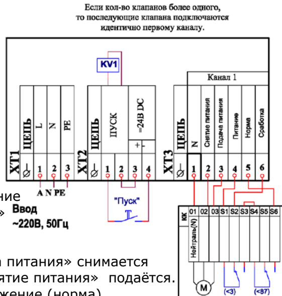
Пример подключения на канал №1 клапана с электромеханическим реверсивным приводом "Belimo" ~220В: